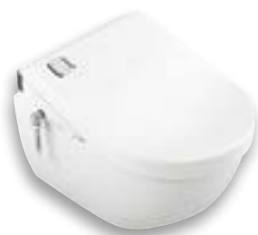
Subway 2.0 DirectFlush